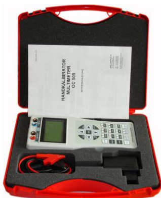
OC505 im Koffer mit Zubehör

Schnelle Signalvorgänge am Messeingang können gespeichert werden. Dafür stehen acht individuelle Speicherplätze TRANSIENT NO.1 ... TRANSIENT NO.8 zur Verfügung. Die Messung erfolgt mit Speicherrate von 1ms. Jede Transiente beinhaltet 256 Punkte und kann zeitlich von 0.25 bis 300 Sek. bestimmt werden. Der Triggerpegel ist wählbar. Ein SoftManager unterstützt Download der Transienten in einen Windows PC.